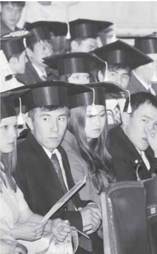
С чем придет в суды новое поколение судей? С глубокими знаниями и четким сознанием своей роли представителя власти или с твердым желанием следовать личным корыстным интересам?