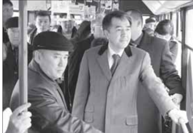
«Свежий» губернатор Павлодарской области Бакытжан САГИНТАЕВ произвел впечатление на подчиненных и журналистов тем, что ездил знакомиться с городом на автобусе, заходил во дворы и даже останавливался рядом с мусорным баком.

Вновь назначенный руководитель Павлодарской области спустя три недели после своего назначения нарушил затворничество и вышел в народ