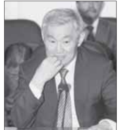
Инвалиды ВОВ и инвалидов «послевоенных» осталось так мало, что их уже не стоит делить на «чистых» и «нечистых». Что вы думаете об этом, г-н министр социальной защиты?

т.д. с мировыми ценами. Так вот ответ этим грамотеям: для сравнения, ветераны войны в США получают пособия по 5000 долларов, а «недобитые» немецкие ветераны войны получают по 2000 евро; ветераны ВОВ в России – по 550 долларов, а наши славные, «любимые» победители получают пособие в 100 евро – в двадцать раз (!) меньше проигравших немцев!