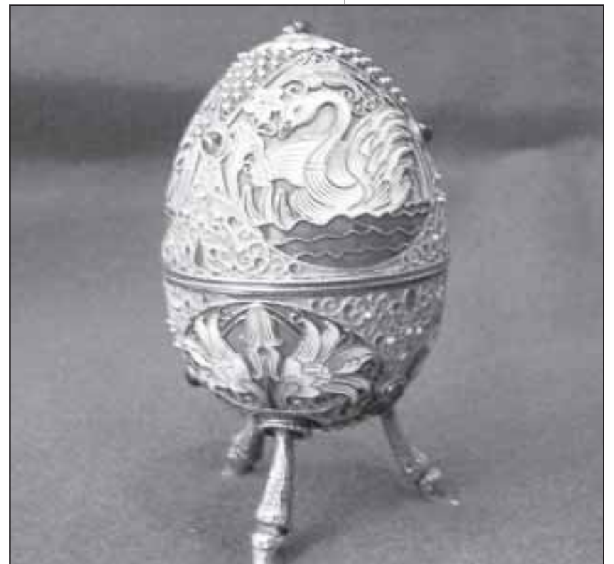
Вот оно, это уникальное яйцо. Судя по клейму, изготовлено оно было в мастерской Карла Фаберже в период с 1908 по 1917 годы.

Если говорить о яйце, то его коллекционеру продала 90-летняя старушка, потомок дворянского рода. Ее родители сослали в Казахстан в 1920-х годах. Семейную реликвию — пасхальное яйцо — стерегли как зеницу ока. Но сейчас старушка осталась одна, и передать наследство некому. Вот и решила ошастливить антиквара.