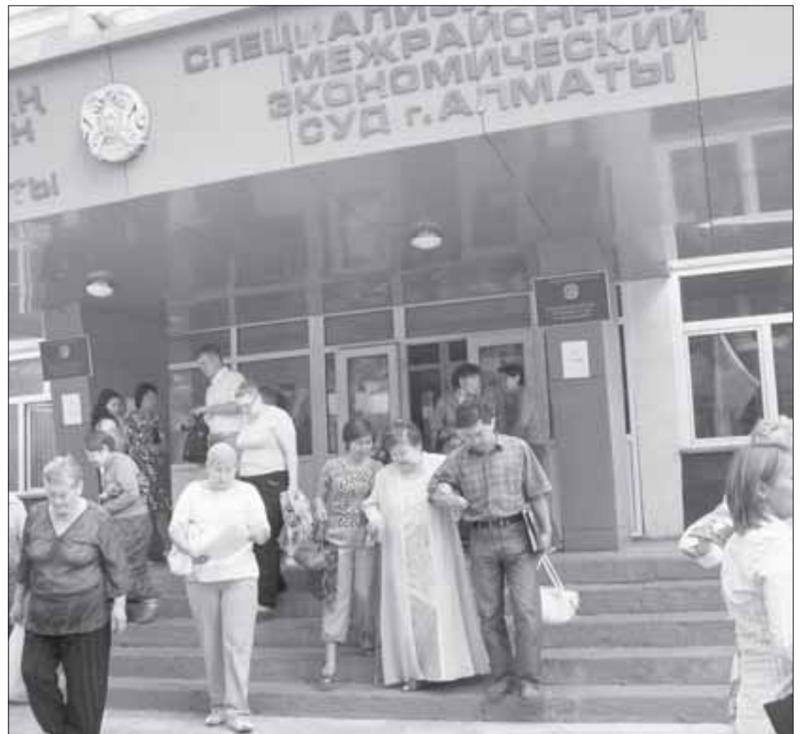
Как свидетельствуют результаты ежеквартальных опросов, сильно мешает борьбе с коррупцией согласие самого населения давать взятки за решение проблем.

Однако мы не смогли найти в открытом доступе детальной «официальной» информации, которая подтверждала бы или опровергала утверждение, что суд яв-